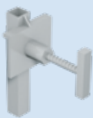
Art. Nr. 22127 elea Spundwandadapter