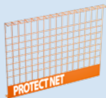
Art. Nr. 22127 elea PROTECT NET Seitenschutzgitter 1,6 x 1,2 m oder 2,1 x 1,2 m, 2,6 x 1,2 m